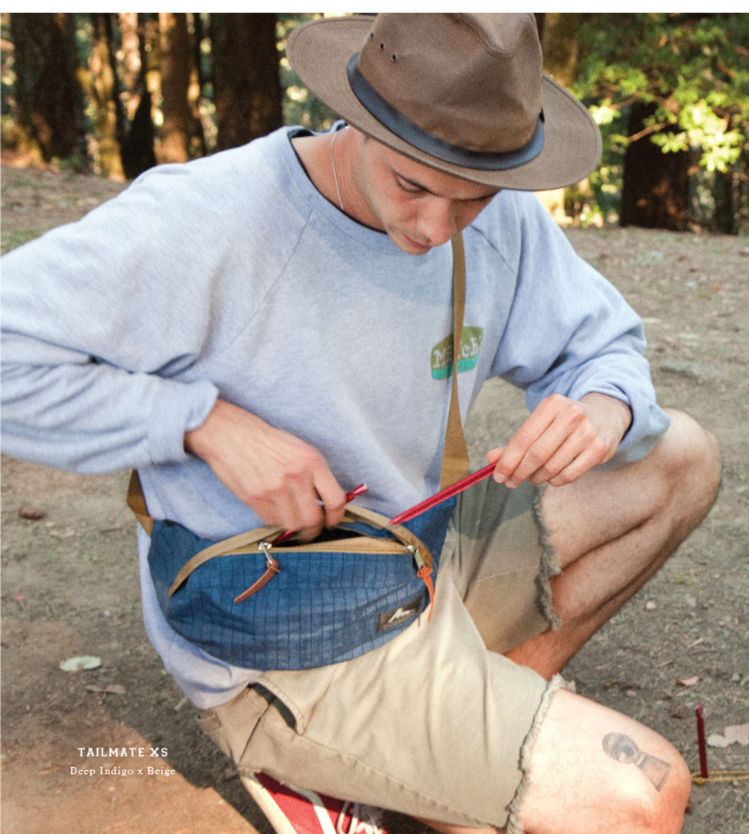
TAILMATE XS Deep Indigo x Beige