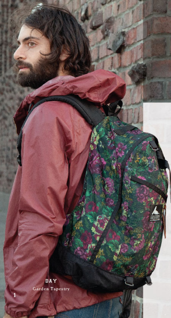
DAY Garden Tapestry